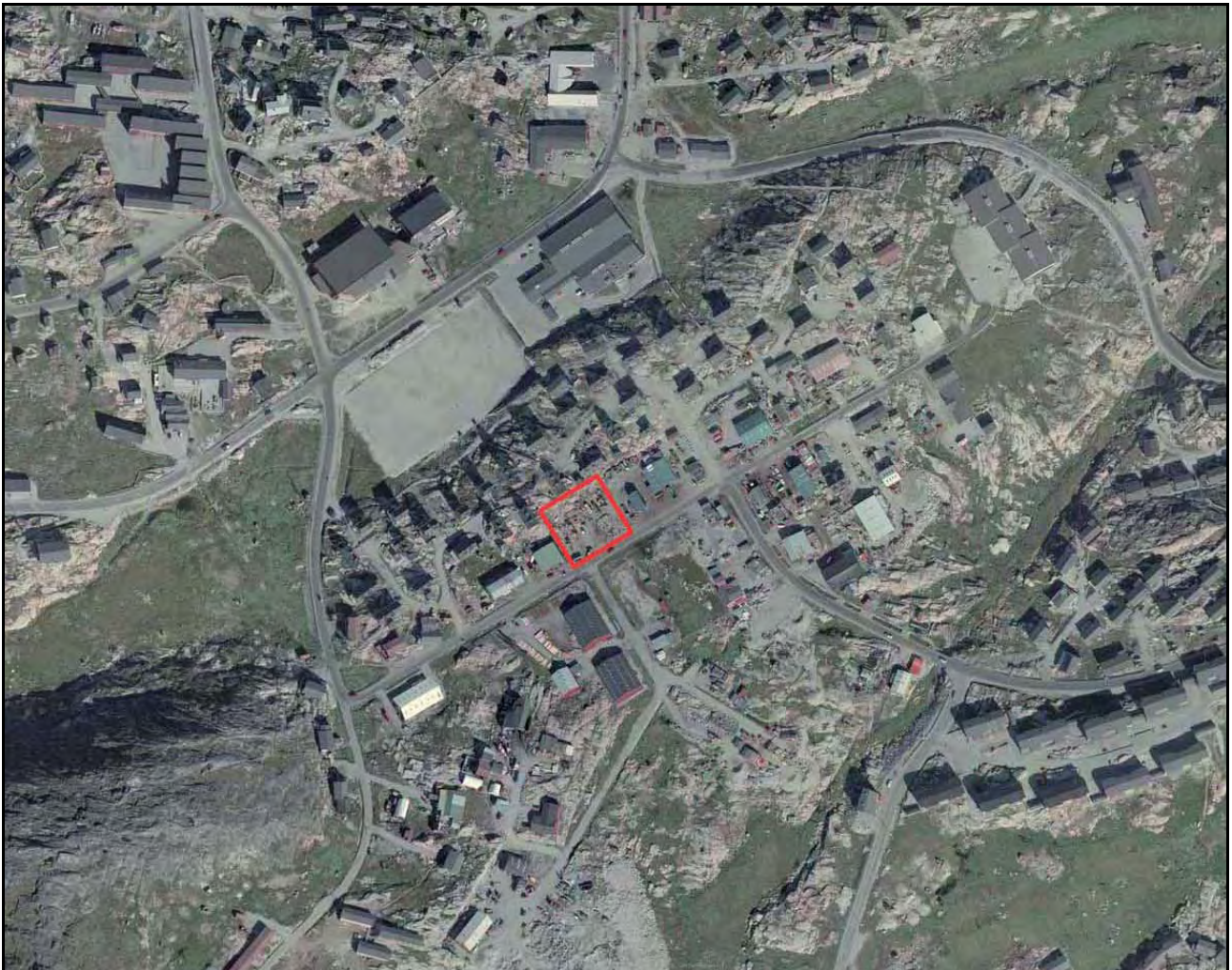
Illoqarfiup iluani immikkoortotami pilersaarutip immikkoortua Lokalplanens område

Lokalplanen har til formål at overføre et mindre område fra boligområde A15 til erhvervsformål, herunder udlægge et byggefelt til erhvervsformål.