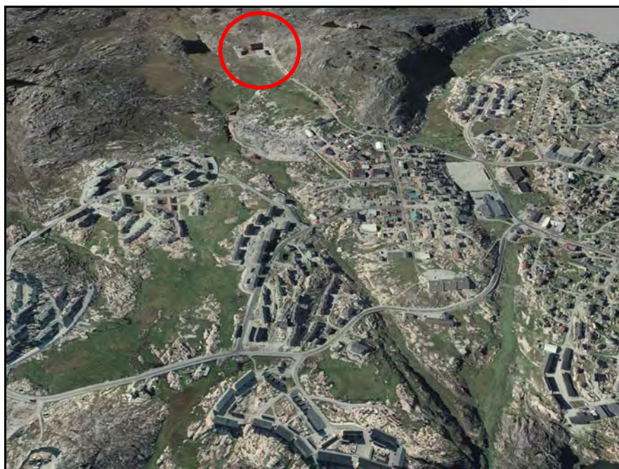
Kangiata Sullissiviata inissinnera / Placering af Kangia Isfjordsstation

Tamanna malunnartikkusullugu Ilulissat Kommuneani Kommunalbestyrelsip Kangiata Sullissivianik ammaanisaq kissaatigaa, Sullissivimmi laboratoria, saqqummersitsinerit, ataatsimiittarfiit isiginnaartitsisarfiillu ingerlatuarneqartut naapitassaassallutik. Ilisimatuut arlallit aammalu assilialortartutut eqqumiitsuliortut suleqatiginerisigut saqqummersitsisarnerit piviusunnagortinneqasapput.